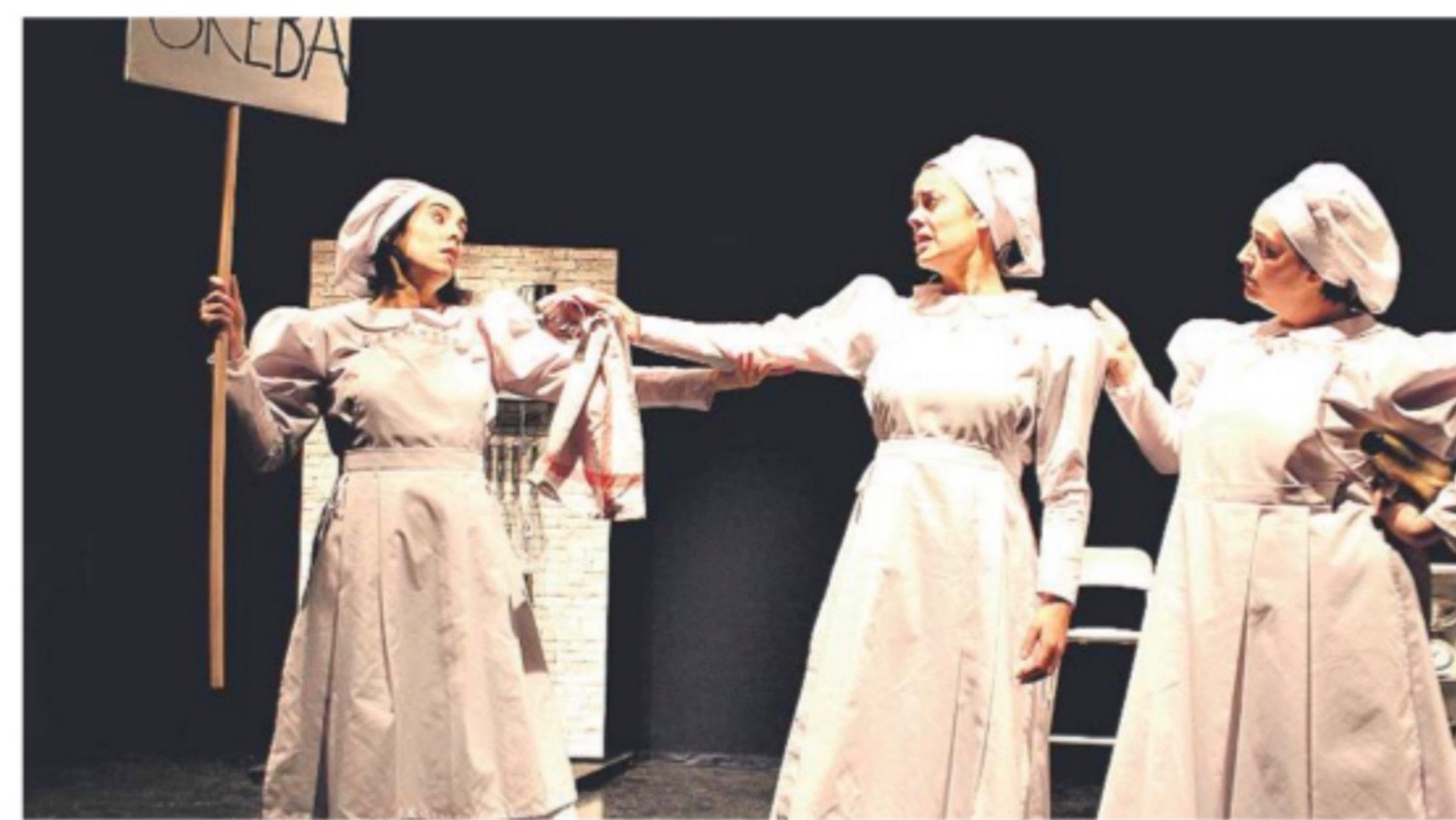
● Gaileta fabrika eta etxea dira antzezlano agertoki nagusiak. EDAEE

Lukaren ama ere andre langilea da. Haren lan baldintzek ere badute gazitik, amonarekin bezala: «Alabarekin egon nahi du, baina ez du denborarik topatzen horretarako. Azkenean, nekatu eta bere bizitza-